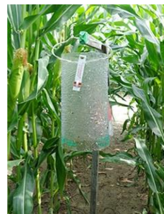
Fig. 2 : Piège à chrysomèle des racines du maïs