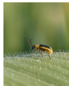
Fig. 3: Chrysomèle adulte

Le 22 février 2024, la Commission technique (CT) production végétale de l'USP a décidé de poursuivre la stratégie et la position actuelles jusqu'à ce que le projet de loi soit transmis par les autorités. Ce texte servira de base pour la discussion. La position de la CT production végétale sera alors consolidée lors d'une réunion spécifique avec l'appui scientifique d'Agroscope, lorsque le texte soumis à la consultation sera disponible.